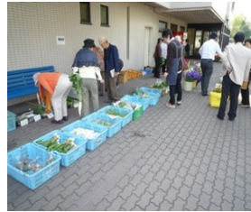
( はじめての朝市 )