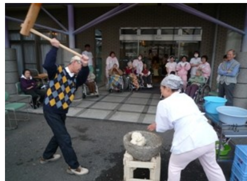
(慈光園の玄関先で力強い餅つき)