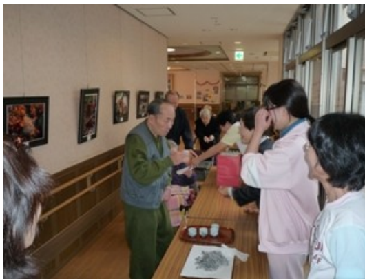
(元旦恒例の地蔵参り)

「聞き上手ボランティア」の募集を始め、お年よりの話し相手になっていただいています。