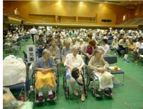
(福祉大会に参加された慈光園の利用者)