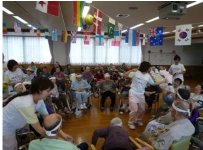
(運動会を楽しむ利用者さんと職員)

11月28日防災訓練を実施しました。緊迫感のある訓練に立ち会っていただいた消防署の方からよい評価をいただきました。利用者さんも避難訓練に参加していただきました。火事が起きないように、普段から注意しましょう!!