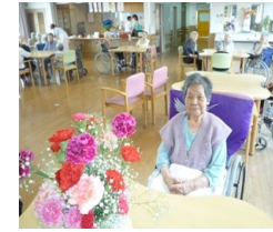
( 母の日のひととき )