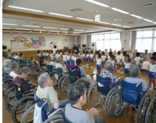
(陵西幼稚園児と楽しい交流会)