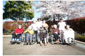
( 園内の庭を散歩する利用者 )