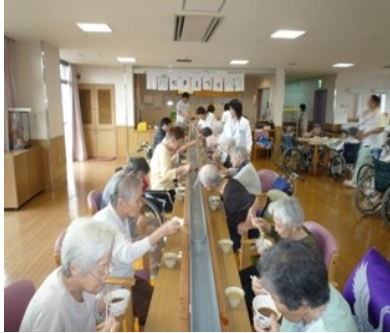
(そうめん流しに食もすみました)

ある高田市民の方よりテレビ16台とDVD4台を寄贈していただきました。地上デジタル放送対応の薄型テレビで、画面もくっきり、きれいになりました。