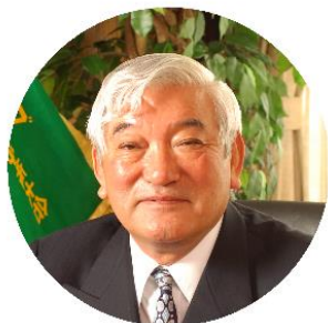
社会福祉法人慈光園 理事長